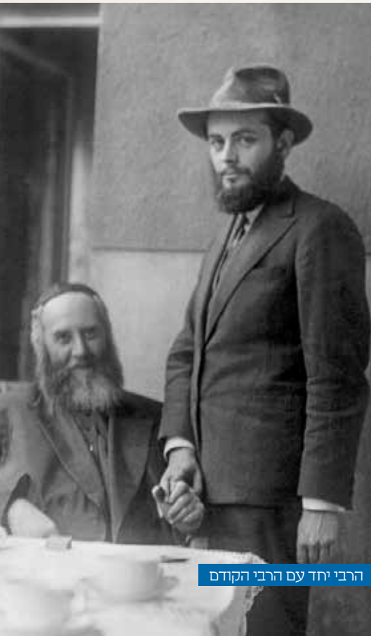
הרבי יחד עם הרבי הקודם

זמן קצר לאחר מכן, בליל שישי, ב' תמוז, נאות כ"ק אדמו"ר שליט"א לבקשת קהל החסידים, שהיו מודעים לעובדה שאירוע חשוב קרה בבית הרב, לכבדם בהשתתפותו בהתוועדות שנערכה לרגל בואו. למעלה משש שעות הצטופפו סביבו חסידים ותלמידי הישיבה