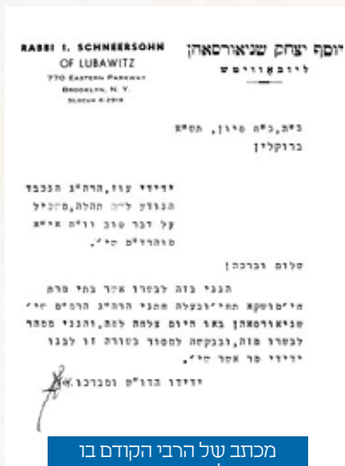
מכתב של הרבי הקודם בו מבשר על ביאת הרבי והרבניות לארצות הברית

בערך אז נתקבלה בקשה מכ"ק אדמו"ר שליט"א להעביר את תיקי המסמכים, המטפלים בבקשת ההגירה, מניצע למארסיי. באותה עת לא היתה ידועה בארצה"ב הסיבה לבקשה זו וכ"ק אדמו"ר שליט"א אף נשאל על כך מחותנו, כ"ק אדמו"ר (מהור"י צ) נ"ע, במברק מיום י"ד טבת.