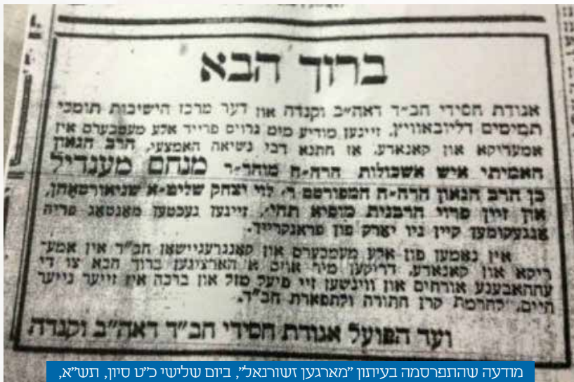
מודעה שהתפרסמה בעיתון "מארגען זשורנאל", ביום שלישי כ"ט סיון, תש"א, בחתימת ועד הפועל של אגודת חסידי חב"ד, בברכת "ברוך הבא", לרבי ולרבנית לרגל בואם ביום שני, כ"ח סיון תש"א לארצות הברית

טרם צאתם את פאריז השמיע כ"ק אדמו"ר שליט"א דרשת פרידה בפני חוג שומעיו, בה עודד את הנשואים ועוררם על החיוניות בבטחון בה' ובעבודתו בכל התנאים. לקיום הדרישה האחרונה לא הי' צורך להביא הוכחות שהדבר אפשרי: הנהגתו האישית של כ"ק אדמו"ר שליט"א יכלה לשמש לשם כך דוגמא למופת. באותה עת כבר נפוצו עליו בין יהודי פאריז סיפורי מופת, בנוסף לידיעות על גאוותו היהודית שאין בה פשרות ועל מסירות נפשו לקיום מצוות בכל ההידור האפשרי.